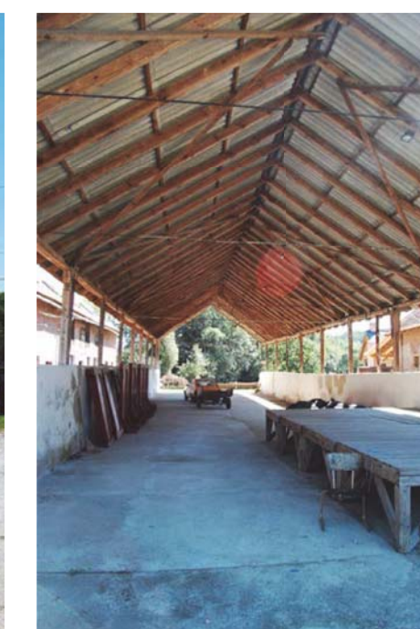
06 Volt trágya tároló