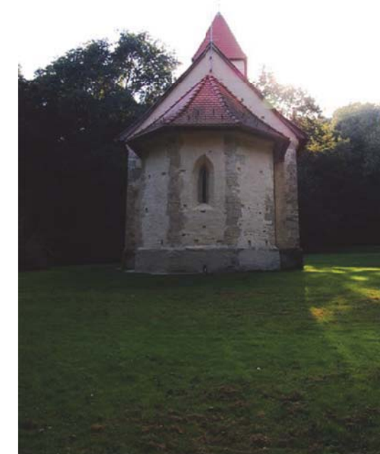
Velemér - Árpád kori templom