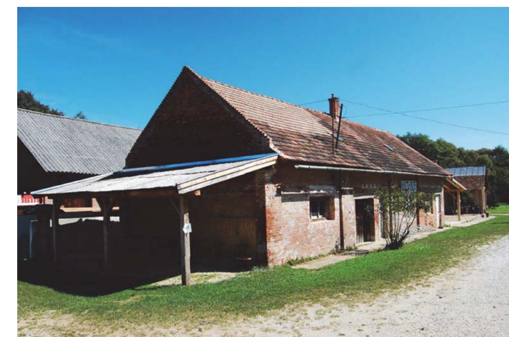
05 Bicikli kölcsönző, raktár