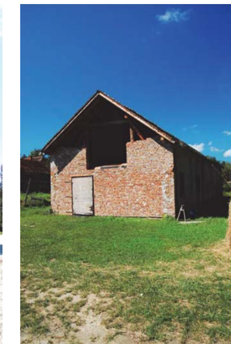
04 Gazdasági épület