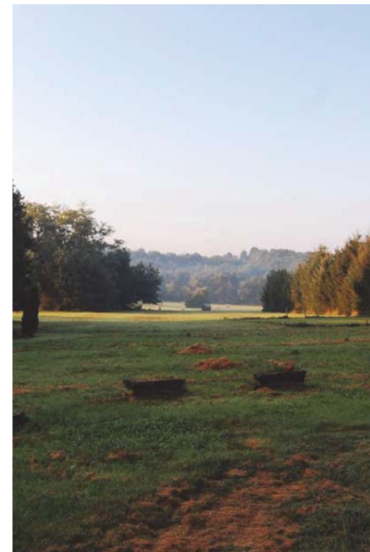
Őrszentpéter - Siskaszer egy portája