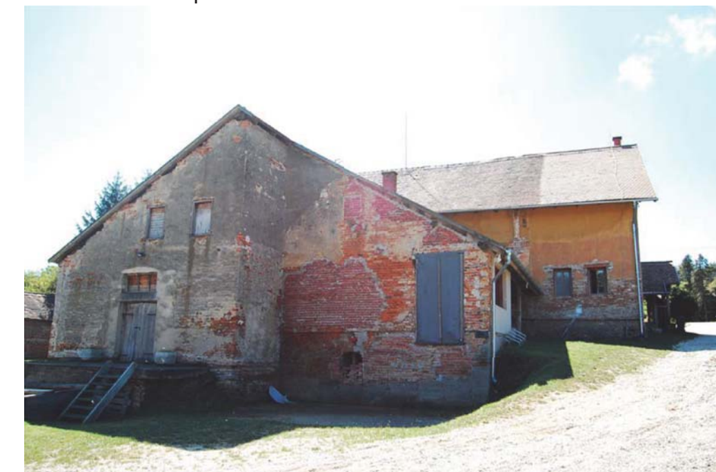
03 Teleház hátsószárnya