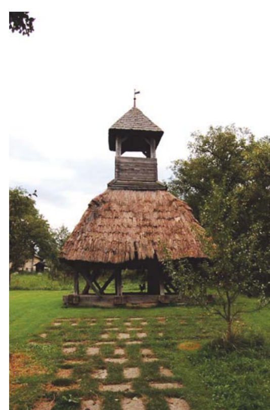
Pankasz - harangláb 1755-ből