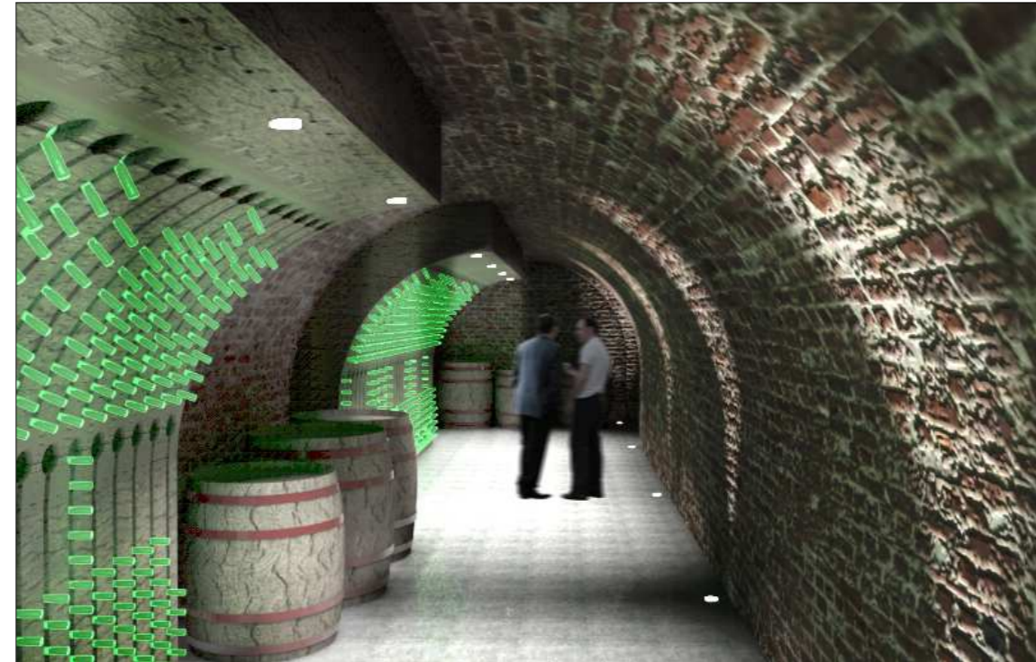
BORMÚZEUM, BORTREZOR HELYSÉGÉNEK LÁTVÁNYA