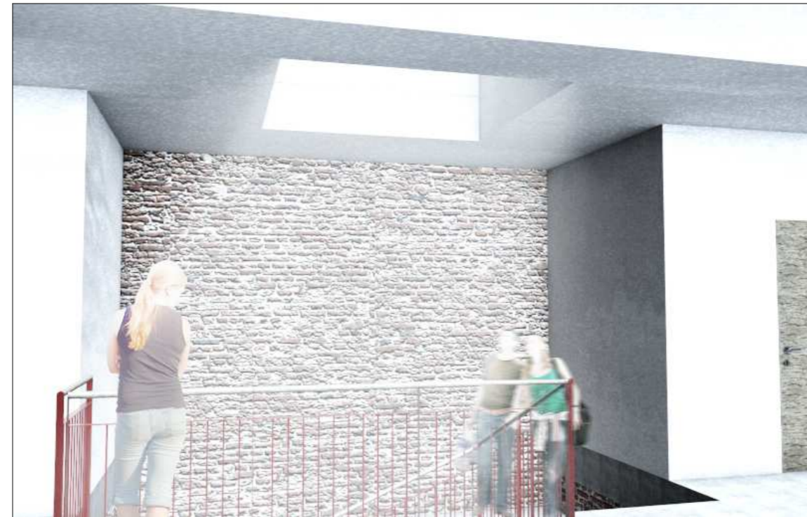
FOGADÓTÉR - LÉPCSŐHÁZ