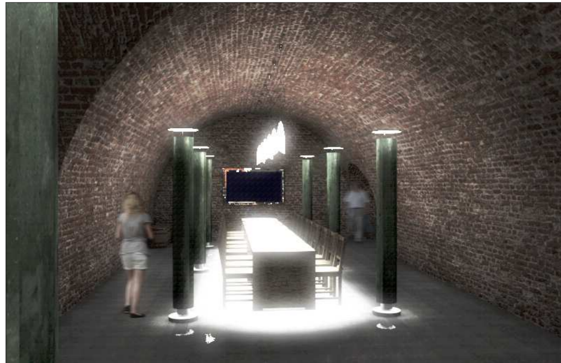
NÉZET A RENDEZVÉNYPINCÉBEN KELET FELÉ