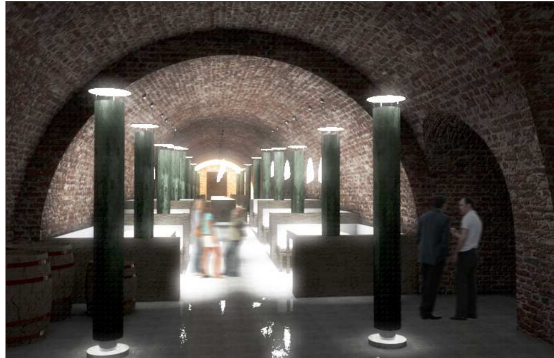
NÉZET A RENDEZVÉNYPINCÉBEN A SÓFAL (NYUGAT) FELÉ