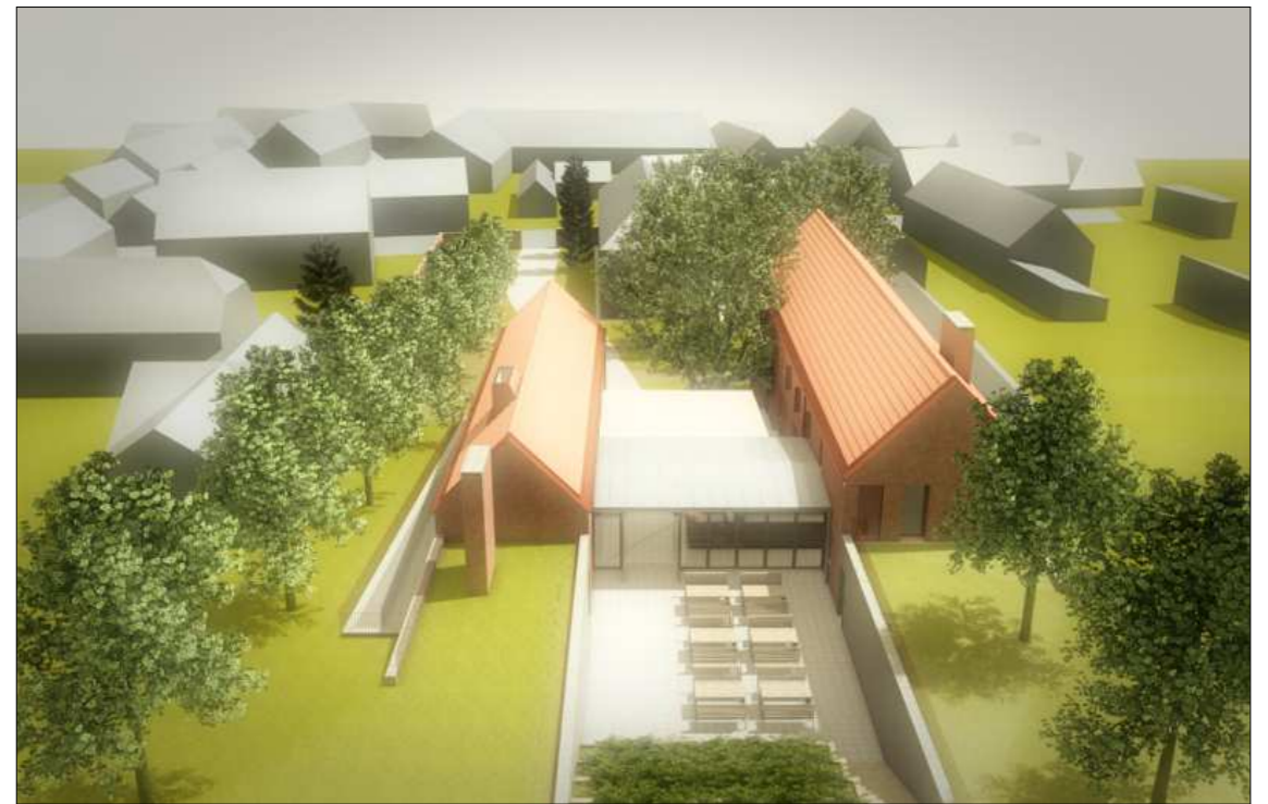
NÉZET MADÁRTÁVLABÓL NYUGAT FELŐL