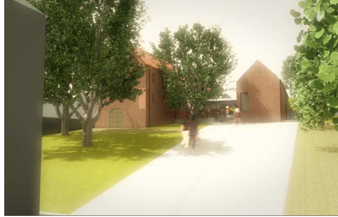
LÁTVÁNY A MEGÉRKEZÉS FELŐL