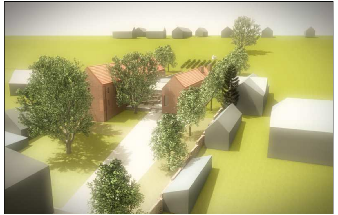
NÉZET MADÁRTÁVLABÓL ÉSZAK KELET FELŐL