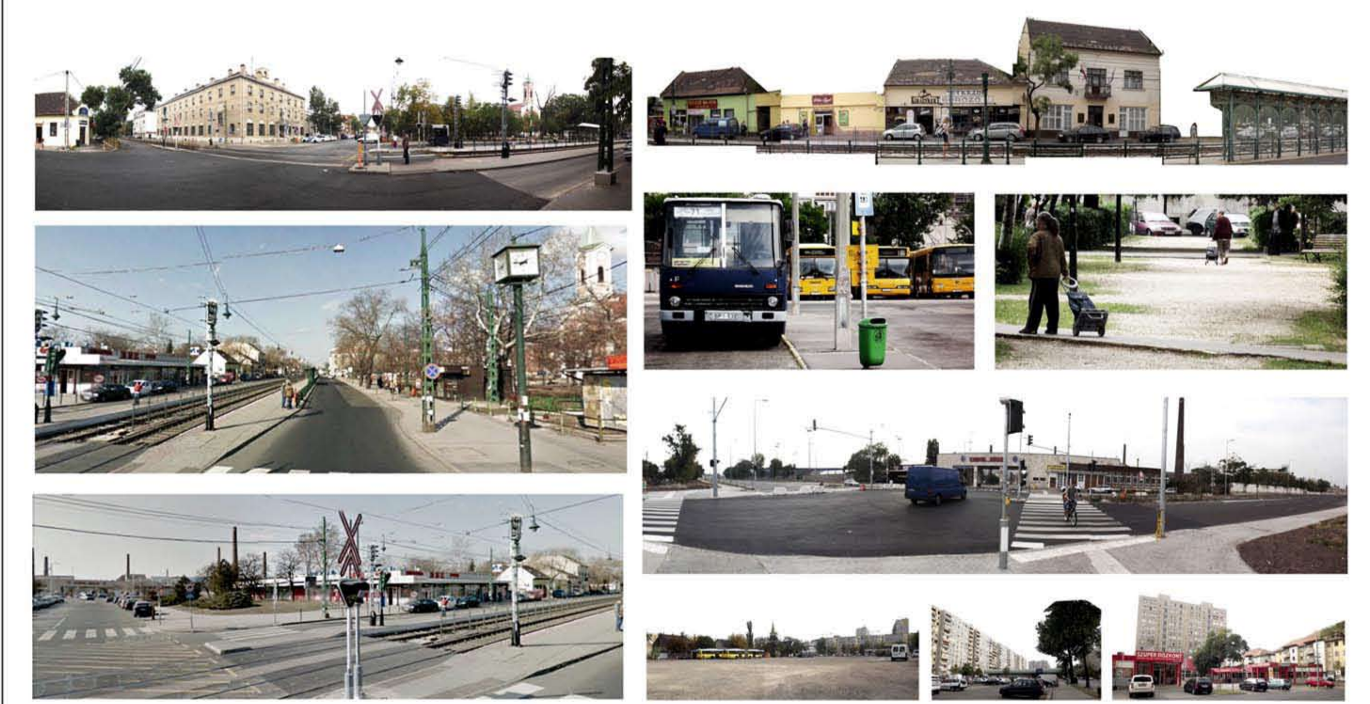
széteső kerületközpont _ de az alapvető adottságai megvannak _ sok ingázó _ forgalommal terhelt _ vegyes beépítés- középületek, panel, családi házas, ipari