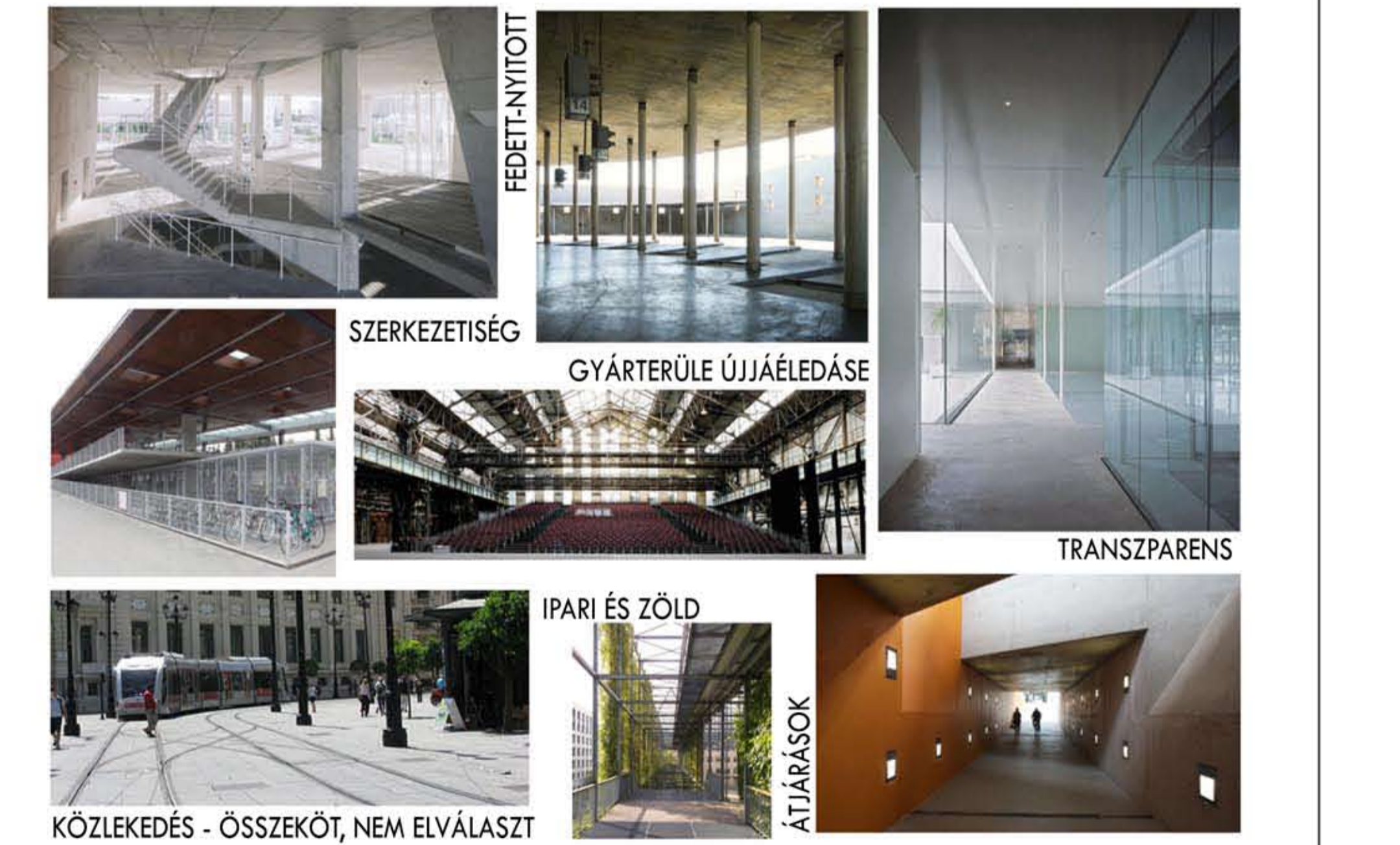
FUNCTIONÁLIS ÉS SZERKEZETI ELŐKÉPEK /VÍZIÓK A KERÜLETRŐL, A TERVHEZ