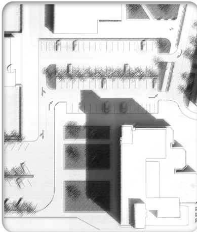
mártírok útja - rét utca csomópont