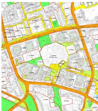
2. ábra PÉSZ szabályozási tervlap

Önálló gyalogút tengelyek északra a kertváros irányába