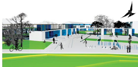
a "vizek tere" a Termál útról