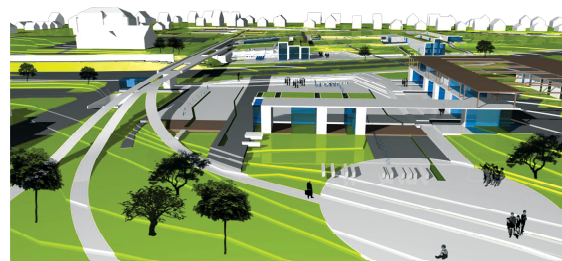
gyógyfürdő tér a termál út felé