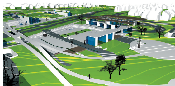
"vizek tere" a híddal és a rámpákkal