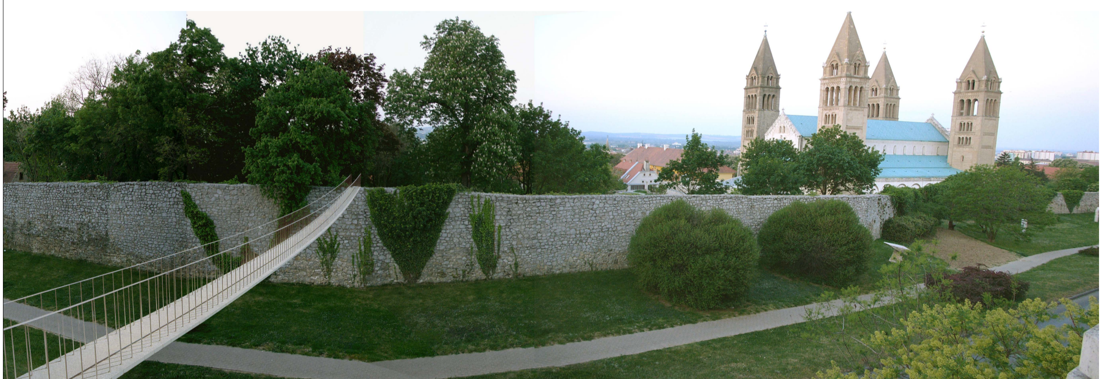
látvány az Aradi vértanúk útja felől

MÉCSK UTCA - NAGY KIÁLLÍTÓTÉR TERÜLETÉNEK ÖSSZEKÖTÉSE A Mécsk utca gyalogos forgalmának bevezetésére függőszelvény gyalogpontonál terveztük. Felső pontján a sétány terepére első közlekedést hoztuk fel a híd fogadására, alsó pontján pedig rönök épített lépcsőszelvény. A tartáskezelést akadémiai körökkel lehorgonyozása is itt történik. A két végpont között további alátámasztást nem terveztük. A miniatűr vészt vésztávhoz semmilyen mértékben nem nyúlunk.