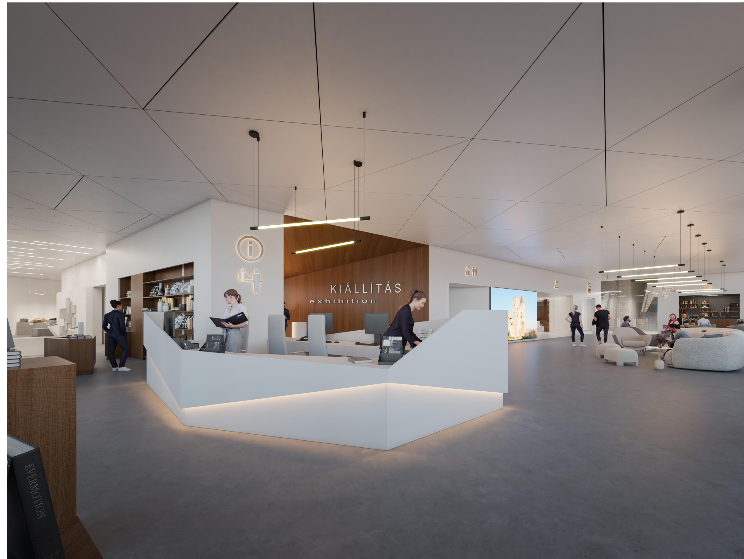
SHOP + RECEPCIÓ