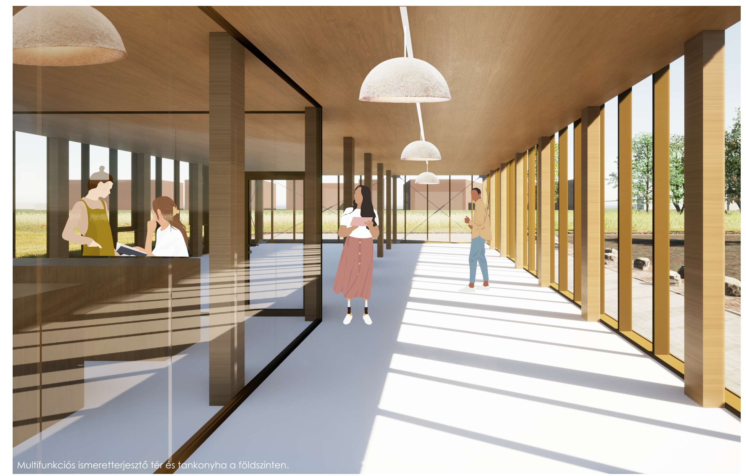
Multifunkciós ismeretterjesztő tér és konyha a földszinten.