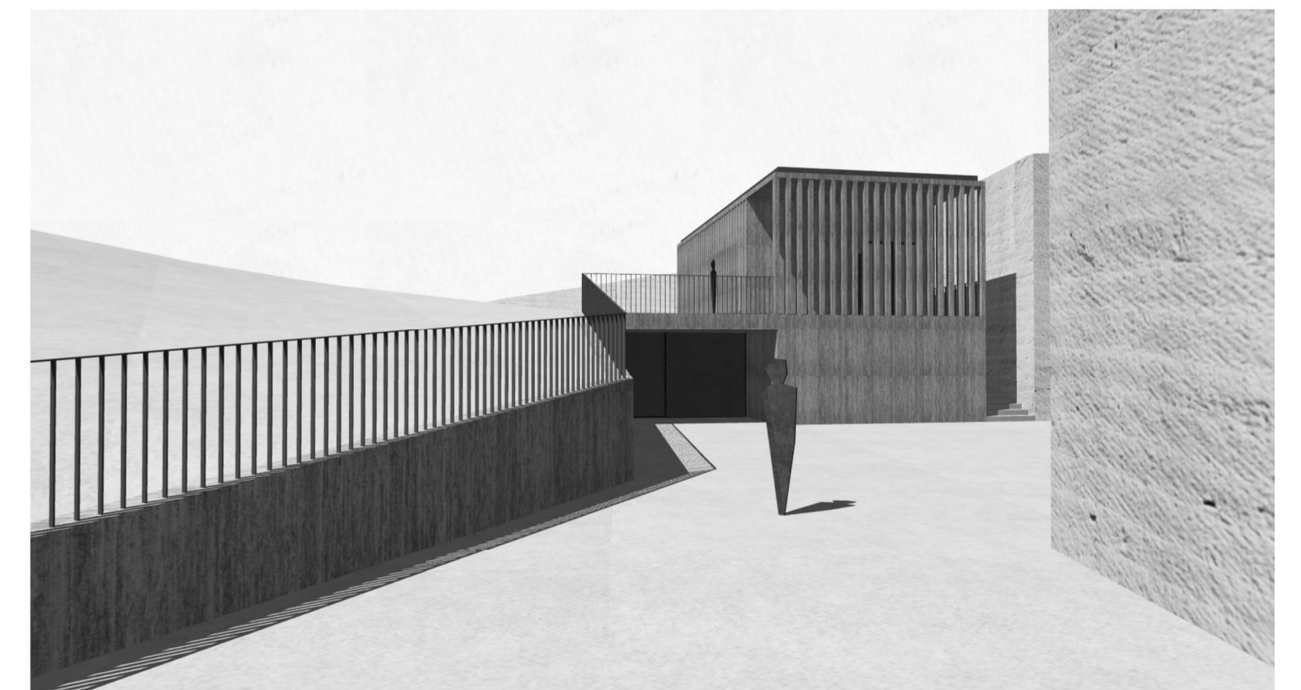
Érkezés déli felől