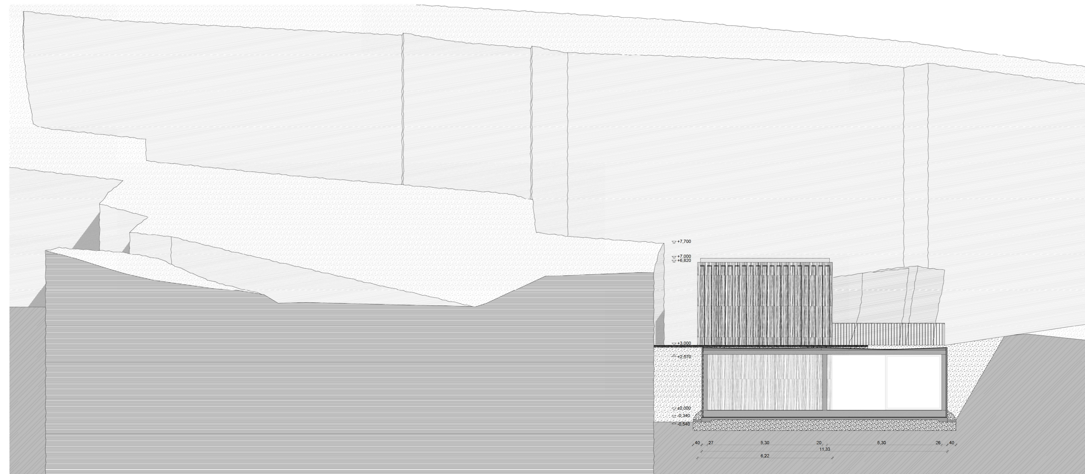
Északi homlokzat és metszet a borraktáron keresztül