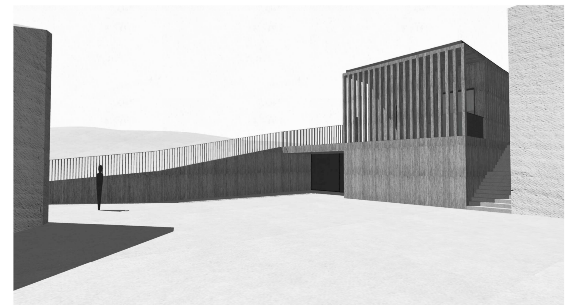
A külső udvarból visszanezve a fogadóépületre