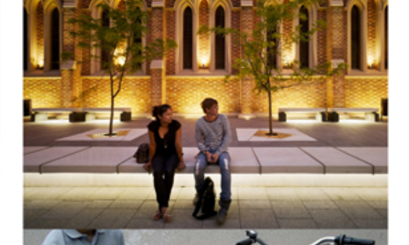
rejtett közvilágítás a padok alatt