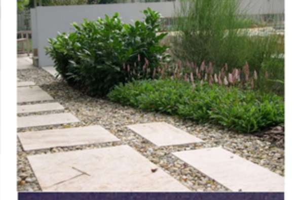
kavicsba ágyazott burkolat egyesdi betonlap burkolat