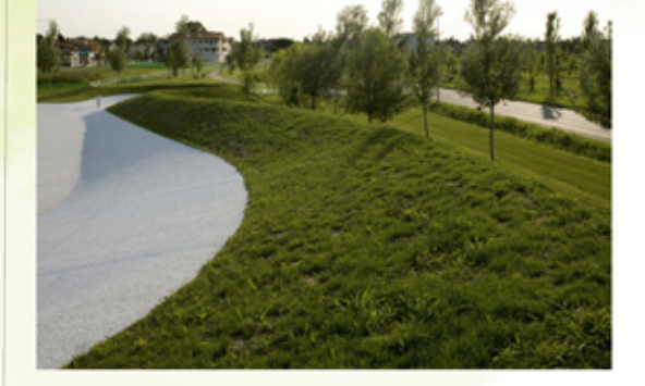
térfal képzés zöldfelülettel