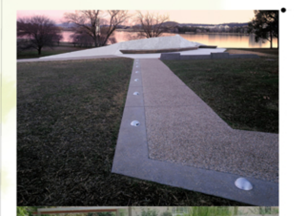
egyesdi betonlap burkolat